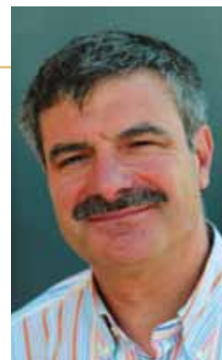
par TONY MASAPOLLO

pas faire de miracles. Autre grande difficulté, l'interprétation des aménagements liés au handicap mental ou auditif n'est pas toujours très simple et difficilement compréhensibles par les exploitants de réseau et d'infrastructures de transport. Pour les personnes non voyantes les résultats ne sont pas encore très glorieux puisque seulement 54% des autobus disposent d'un système sonore du prochain arrêt. Le handicap moteur certes plus facile à comprendre ne permet pourtant pas de bénéficier d'aménagements systématiques. La limite de février 2015 ne sera sans doute pas suffisante pour que tous les acteurs du transport offrent des prestations accessibles à toutes les personnes handicapées. Pimas avec son savoir faire peut accompagner ces acteurs du transport et les accompagner dans leur choix techniques et je profite de cet édito pour les inviter à nous contacter.